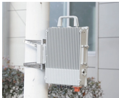
电源模块安装示意图